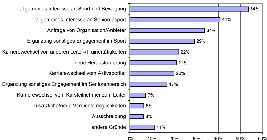
Abbildung 1: Hintergrund und Motivation des Engagements im Seniorensport (Anteile an allen Befragten in Prozent, Mehrfachnennungen möglich, n=993)

Leiter/innenkurs meldet oder vom Kursteilnehmer zur Leiterposition „aufsteigt“. Auch andere Tätigkeiten im Seniorensport oder finanzielle Überlegungen („Verdienstmöglichkeiten“) sind als Anstoss für eine Leitertätigkeit vergleichsweise unwichtig.